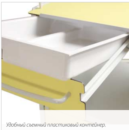
Удобный съемный пластиковый контейнер.