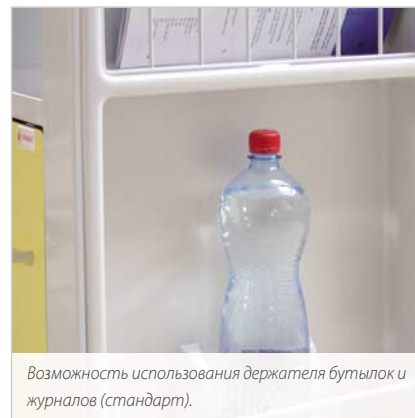
Возможность использования держателя бутылок и журналов (стандарт).