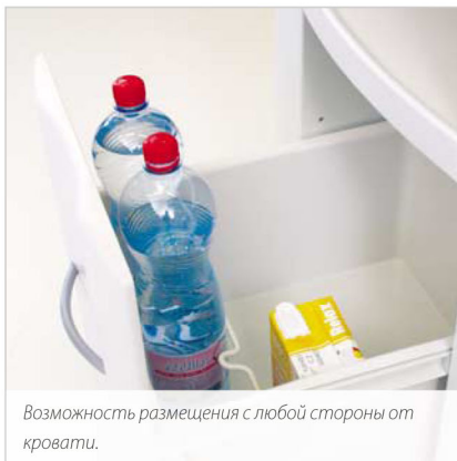
Возможность размещения с любой стороны от кровати.